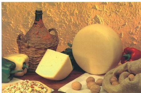
Pecorino di Latte Crudo